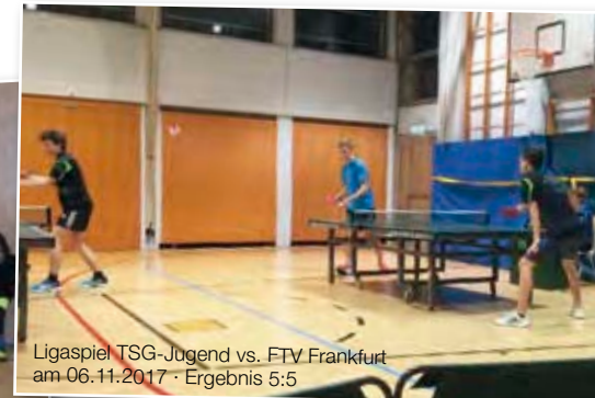
Ligaspiel TSG-Jugend vs. FTV Frankfurt am 06.11.2017 · Ergebnis 5:5