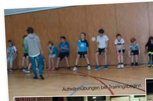
Aufwärmübungen bei Trainingsbeginn

Auch von meiner Seite alles Gute und sportliche Grüße Axel Backhove