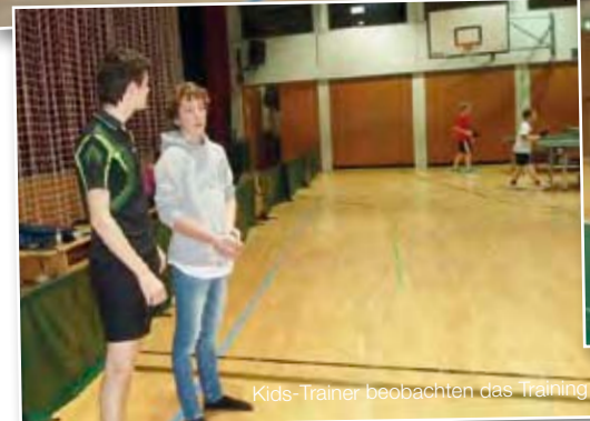
Kids-Trainer beobachten das Training